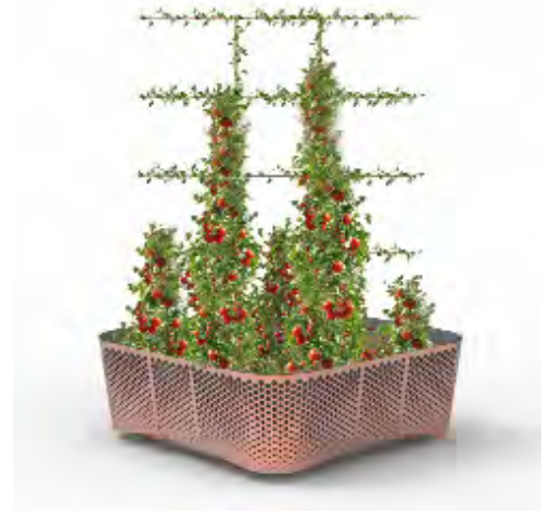
Jardinière carrée + treille (1,15m LX 40cm H) à partir de 958 euros